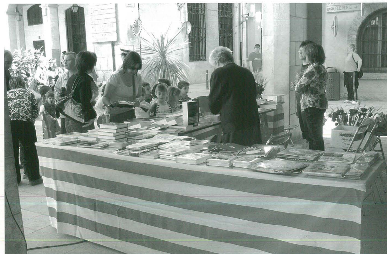
Els més petits també participen en la Festa del Llibre i la Rosa