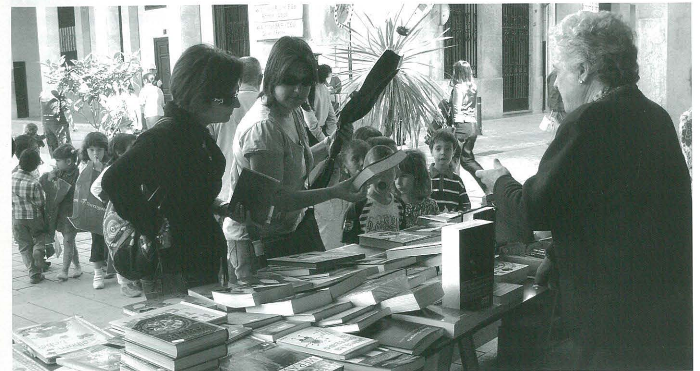
Diada de Sant Jordi 2009